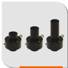
Gruppi ottici/focali intercambiabili