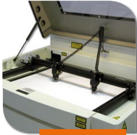
Doppia testa di lavorazione