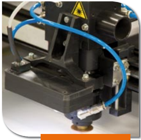
Kit CCD camera per taglio a registro/lettura marcatori