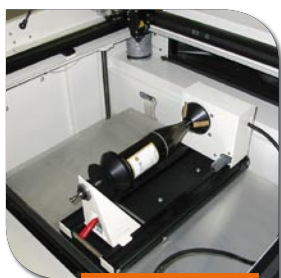
Divisore singolo 360°