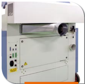
Flangia supplementare per aspirazione